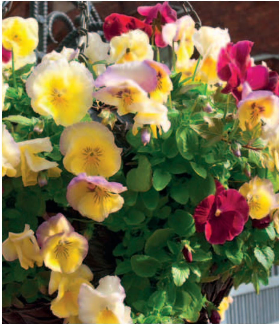
TARHAORVOKIT voi istuttaa myös amppeliin, kunhan niitä lannoitetaan säännöllisesti.

Kerran kesässä kukkivat monivuotiset orvokkilajit, kuten perhos- ja tuoksuorvokki, eivät kaipaa erityishoitoa. Yleensä riittää, kun kasvualusta peruslannoitetaan ja -kalkitaan ennen istutusta ja taimien väleistä poistetaan rikkakasvit.