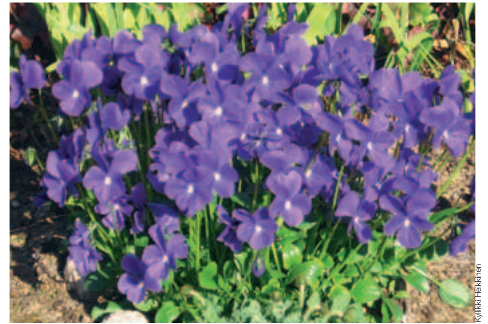
ALTAINORVOKKI talvehtii hyvin ja muistuttaa isoine kukkineen sarvi-orvokkeja.

Monivuotisen altainorvokin ( Viola altaica ) kukka on yhtä iso kuin tarhasarvi-orvokkeilla. Teriö on pääsääntöisesti sinivioletti, harvemmin valkoinen, keltainen tai kaksivärinen. Altainorvokki kukkii runsaimmin touko–kesäkuun vaihteessa. Koska se remontoituu vähäisempää kukintaa voi odottaa keski- tai loppukesällä. Laji leviää siementämällä ja talvehtii hyvin, kun kasvualusta on läpäisevä.