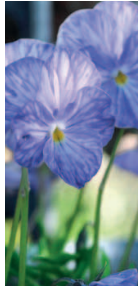
’ JOHN WALLMARK ’ on monivuotinen isokukkainen tarhasarvi-orvokki.

Komeita isokukkaisia lajikkeita Meilläkin yleisten monivuotisten tarhasarvi-orvokkien ( Viola Cornuta -ryhmä) suuret yksi- tai moniväriset kukat periytyvät muun muassa sarvi-orvokilta ( Viola cornuta ). Viljeltynä harvinaistunut sarvi-orvokki kasvaa luonnonvaraisena Ranskassa ja Espanjassa Pyreneiden vuoristossa kivisillä rinteillä ja